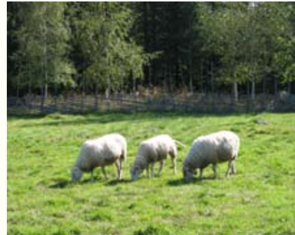
Markerna på Våsbo har använts till slåtter och bete under flera hundra år.

På Våsbo finns också marker där man odlade korn och tog hö till djurens vinterfoder. Odlingarna skyddades från djuren