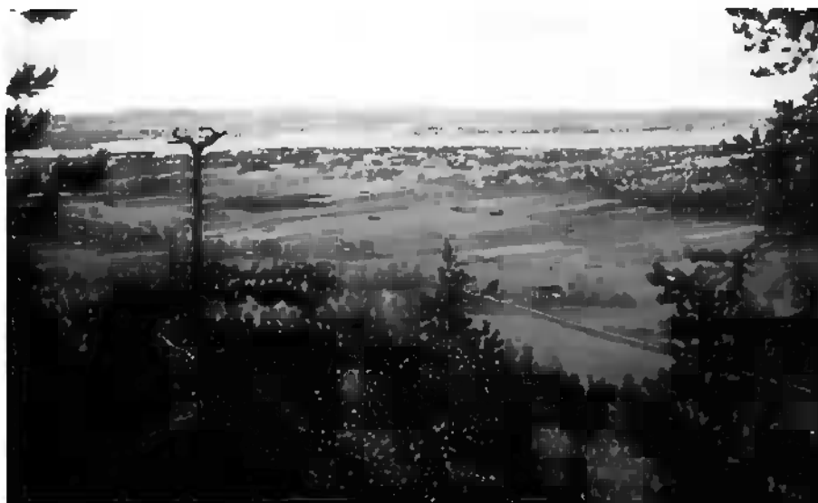
Utsikt från Kölberget

Vi träffas vid ICA parkeringen för samåkning kl. 18.00. Ta med fika! Kent, tel. 0278-65 09 19 eller 070-350 19 92