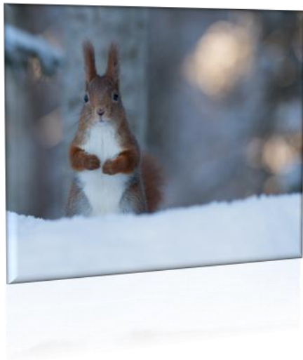
En ekorre som fångats på bild av Hans Ollonen, Alfa

Stefan Karlberg, Söderhamn skickar en bild på kanotisten som paddlar uppför Lötån.